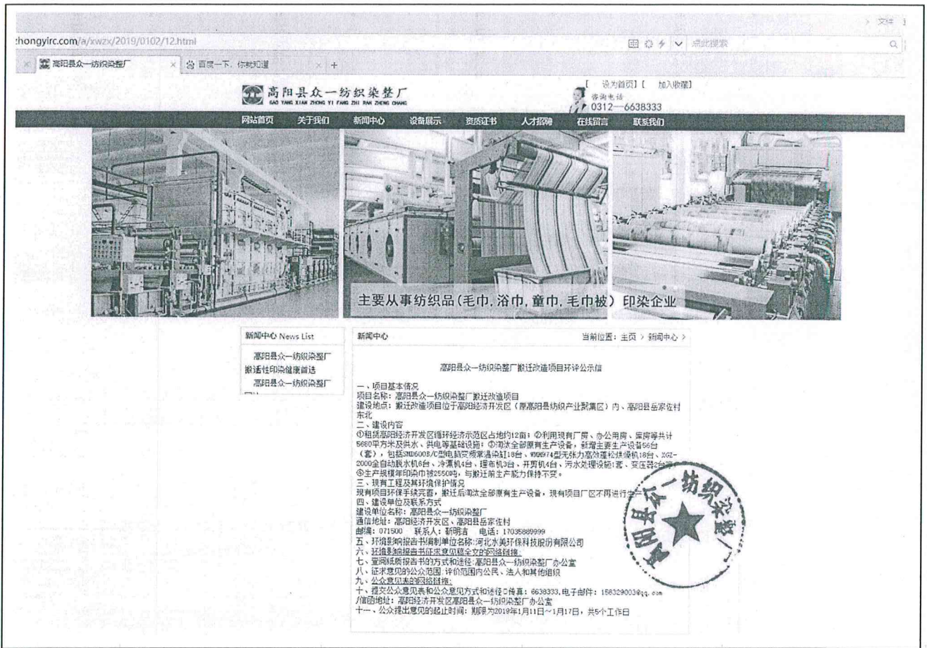
图 3-1 征求意见稿网络公示截图